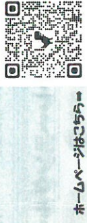
ホームページはこちら